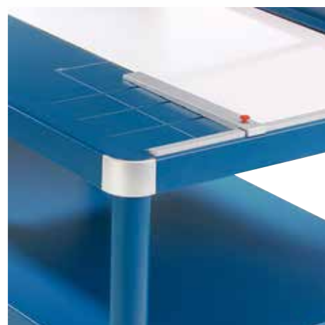
Nastavitelný zadní kovový doraz k rychlému formátování, použitelný na obou úhlových příložnicích a předním stole