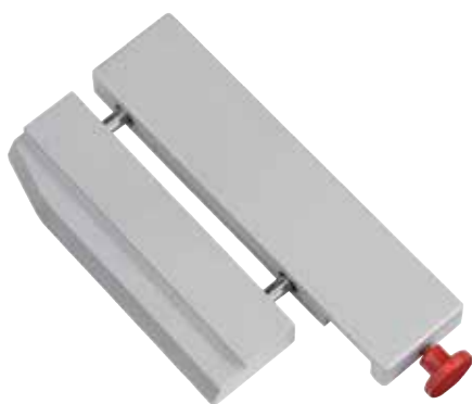
Na přání zařízení k řezání extrémně tenkých proužků