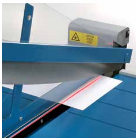
Na přání přesné laserové naznačení řezu zajišťuje profesionální výsledky řezání