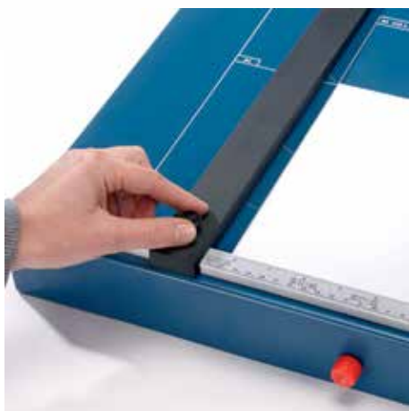
Nastavitelný zadní kovový doraz se šroubovým upevněním k rychlému formátování, použitelný na obou úhlových příložnicích