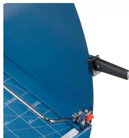
Ochranný plech nože pro bezpečnost při řezání