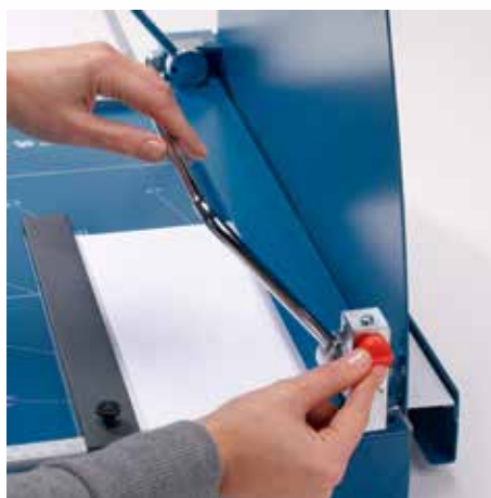
Aretovatelné přitlačné rameno zajišťuje optimální zafixování řezaného materiálu