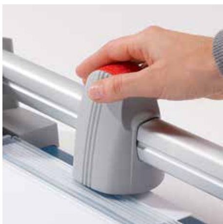
Ergonomická řezací hlava pro komfortní obsluhu řezačky