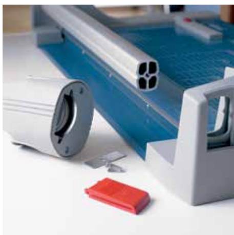
Jednoduchá výměna hlavy nože zajistí plynulou práci