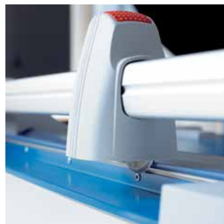
Kotoučový nůž v uzavřené plastové hlavě zaručuje maximální míru bezpečnosti