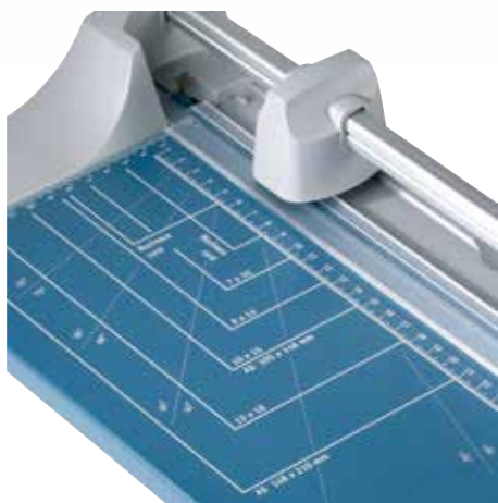
Praktické linie formátování usnadňují vyrovnaní řezaného materiálu