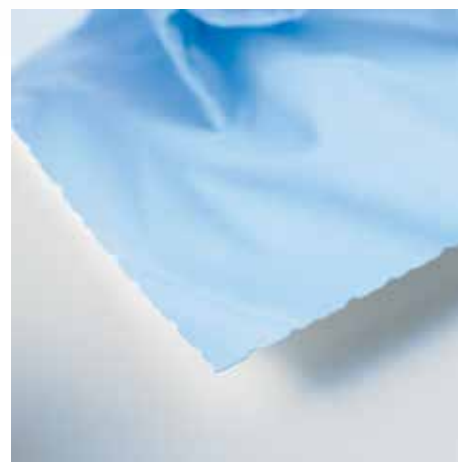
Nepravidelná řezná hrana ke zpracování okraje papíru