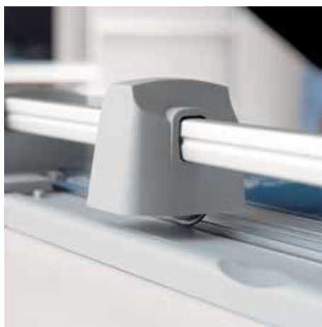
Uzavřená hlava nože pro bezpečnou obsluhu řezačky