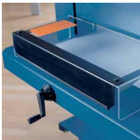
Průhledné ochranné kryty poskytují jistotu a volný výhled při řezání