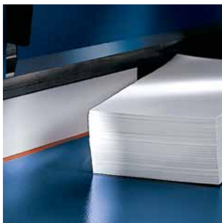
Velké množství papíru je zpracováno s minimálním úsilím