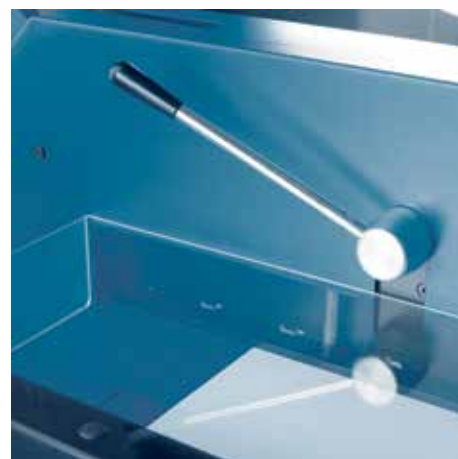
Komfortní rychlý přítlak pro plynulou práci