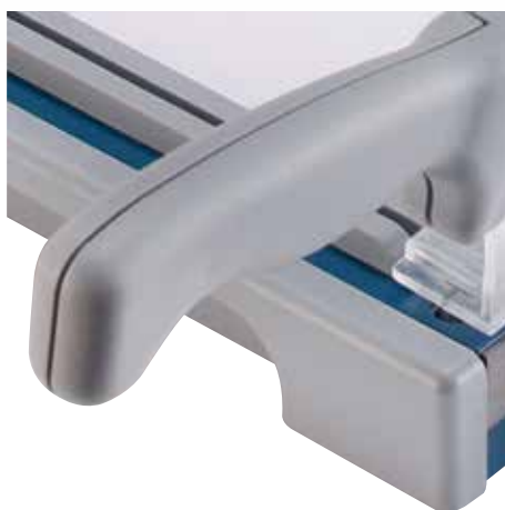
Ergonomicky tvarovaná rukojeť zajistí pohodlné řezání